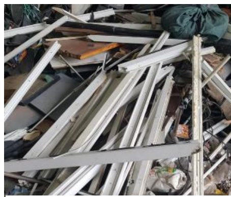
Rámy plastových okien (PVC)