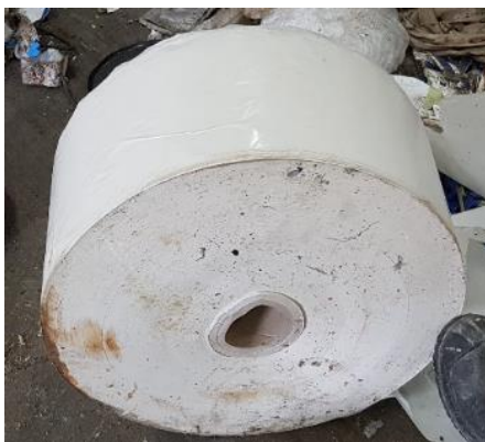
Materiál na kotúčoch (papier, plast, kovové rolky)