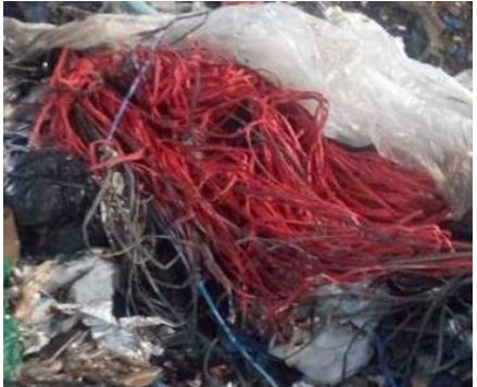
Povrazy, laná a špagáty