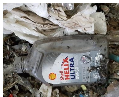
Obaly kontaminované nebezpečným odpadom