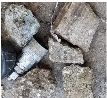
Betóny a iný stavebný odpad