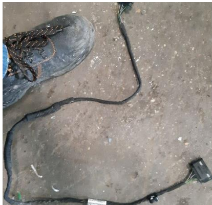
Káble potiahnuté PVC