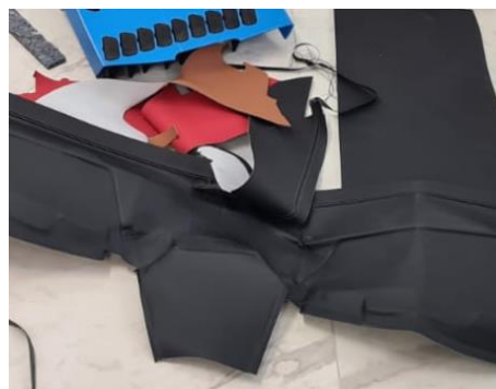
Plastové potahy s obsahom PVC