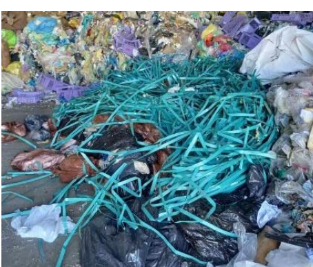
Plastové viazacie pásy