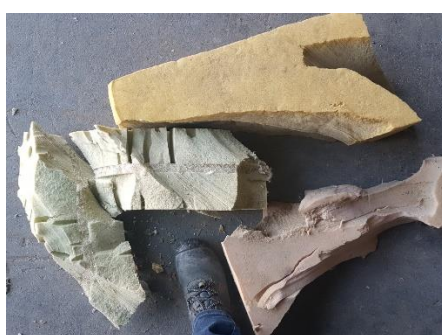
Molitány a matrace