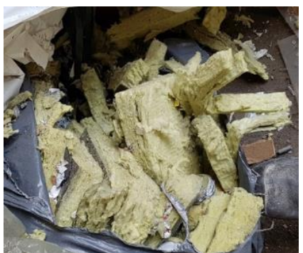
Sklenená a minerálne vlna