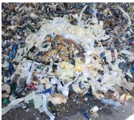
Etiketovací papier na roľkách