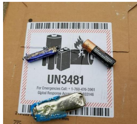
Alkalické a lítiové batérie

Odpad musí byť dodaný takým spôsobom, aby bolo možné jeho vyloženie bez dodatočnej manipulácie zamestnancami spoločnosti ecorec Slovensko s.r.o. (tj. kontajnery, návesy s posuvnou podlahou, prípadne skriňovou dodávkou, ak si vodič sám zabezpečí vyloženie v rámci platných BOZP pravidiel). Odpad nemôže byť byť dodaný v bigbagoch ani iných prepravných boxoch. V prípade dovozu na paletách či už drevených alebo platových, budú tiež použité na výrobu TAP.