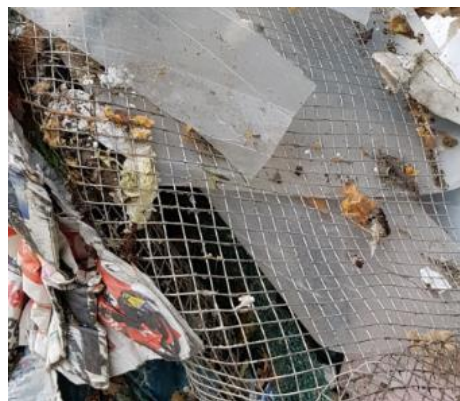
Siete (plastové, kovové alebo textilné)