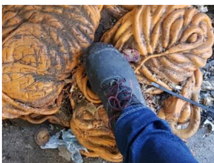
Plastové výtoky a spekanec