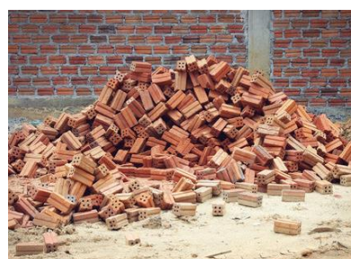
Nepodrvná tehla bez nečistôt