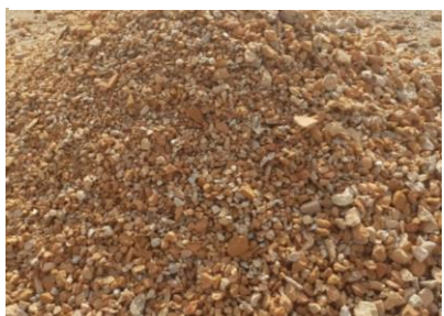
Podrvná tehla (obsah min. 80%)